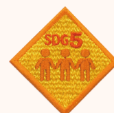
GEバッジ対面オレンジ