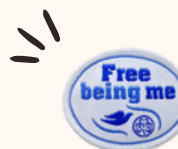
FBM大好きなわたしバッジ