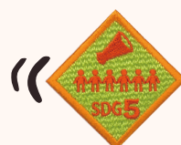
GEバッジ対面グリーン